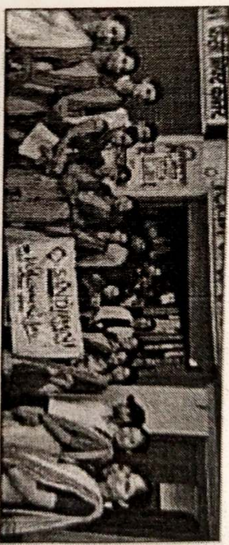
श्री सांदीपनी एकेडमी के प्राथमिकी कार्यक्रम का शुभारंभ।

राष्ट्रीय एकेडमी अछोटी मुरमुंडा (दुर्ग) में दिनांक 20/04/2022 से आम जनता के ग्रामों में मुक्त प्राथमिकी को इस शीघ्रता से बढ़ाने के लिए जगसकर अभियान आरंभ किया गया। ग्राम गोदी, अछोटी, मुरमुंडा, कंडरका, चौरासी आदि गांवों में प्राथमिकी को बढ़ाने का यत्न उपलब्ध कराने इस अभियान चलाया जा रहा है। आज दिनांक 05/05/22 को ग्राम अछोटी के ग्रामवासियों को मिट्टी का सकोरा प्रदान किया गया जिसमें (शिक्षण विभाग) के शिक्षार्थियों द्वारा ग्रामवासियों के घर-घर जाकर सौजन्य पैकेट का प्राथमिकी को बढ़ावा देने का प्रयास किया गया कि ग्रामों के दिनों में इस अपने छत्र पर आकर और ग्रामों के पास सकोरा में यत्न लगाकर एवं एक मुझे अनाज का टांचा टालकर रखें जोकि प्राथमिकी को ग्रामों के दिनों में यत्न लगाकर ग्रामों में उपलब्ध हो सकें और जो अपने घरों पर सकें। प्राथमिकी को आज